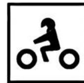
EN 1621-2 Pictogramme moto Cousu à l'intérieur De la dorsale.